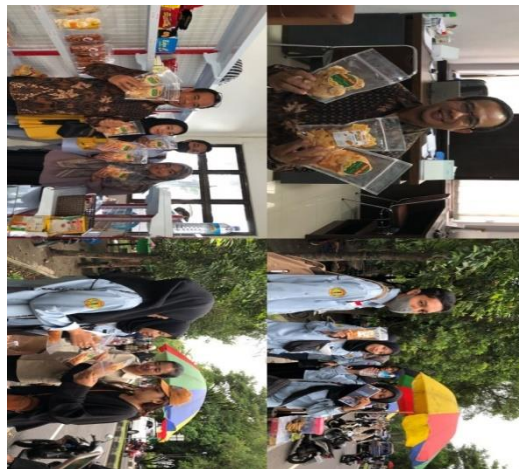
Gambar 13. Foto Pemasaran

Dalam memasarkan produk baik secara offline maupun online, kelompok KKN membuat brosur untuk disebarakan pada saat membuka stand di Udayana maupun di tempat rekreasi kuliner lainnya sebagai media tambahan dalam kegiatan pemasaran.