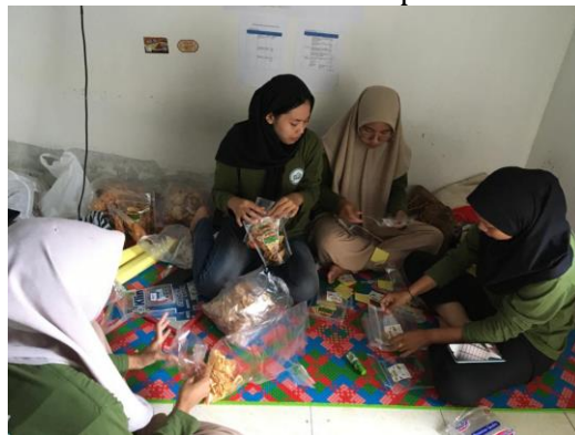
Gambar 9. Pengemasan Produk Tortila Rumput Laut Dan Kripik Talas