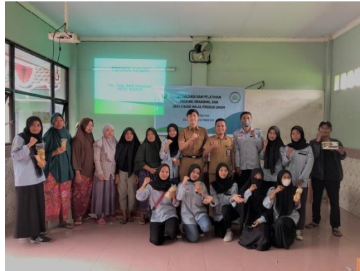
Gambar 5. Kegiatan Sosialisasi dan Pelatihan, Packing, Branding dan Sertifikasi Halal Produk UMKM