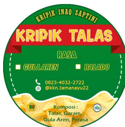
Gambar 7. Stiker Kripik Talas