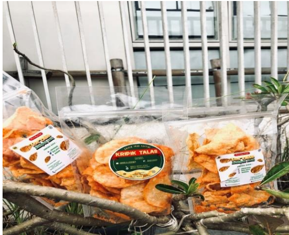
Gambar 8. Kemasan Produk Tortila Rumput Laut Dan Kripik Talas