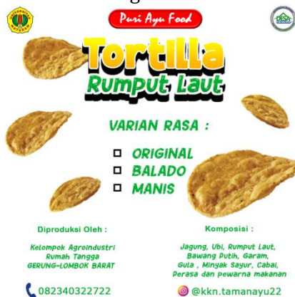
Gambar 6. Stiker Tortilla Rumput Laut

Desain kemasan dan label produk makanan industri rumahan UMK di Dusun Taman dan Dusun Karang Genteng, Desa Taman Ayu Kecamatan gerung, Kabupaten Lombok Barat, sebagaimana ditunjukkan pada Gambar 6 dan gambar 7.