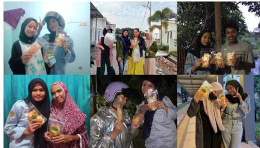
Gambar 12. Pemasaran COD

Untuk kegiatan pemasaran offline kami membuka stand di Udayana setiap hari minggu, dan tempat rekreasi kuliner lainnya seperti jalan lingkar. Selain itu, mahasiswa KKN sudah memasarkan produk UKM ke kantin FKIP Unram Bersama DPL untuk dititipkan.