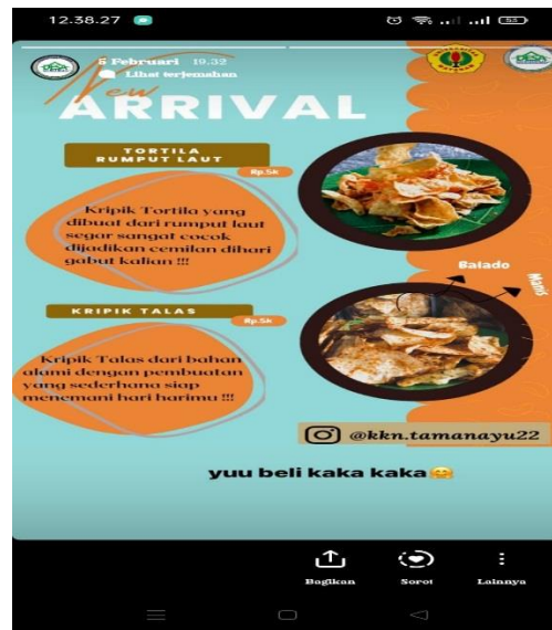
Gambar 11. Pemasaran Via Instagram

Untuk kegiatan pemasaran offline kami membuka stand di Udayana setiap hari minggu, dan tempat rekreasi kuliner lainnya seperti jalan lingkar. Selain itu, mahasiswa KKN sudah memasarkan produk UKM ke kantin FKIP Unram Bersama DPL untuk dititipkan.