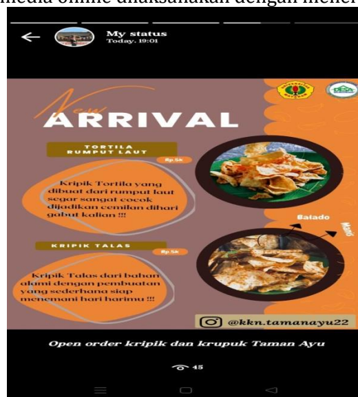
Gambar 10. Pemasaran Via WhatsApp

Kegiatan pemasaran produk UKM Puri Ayu Food dan Kripik Inaq Saptini dipasarkan melalui sosial media (online) dan membuka stand (offline). Adapun melalui sosial media dengan menyebarkan pamflet produk dan mempromosikan melalui story baik di WhatsApp dan Instagram. Pemesana produk melalui media online dilaksanakan dengan menerapkan system COD.