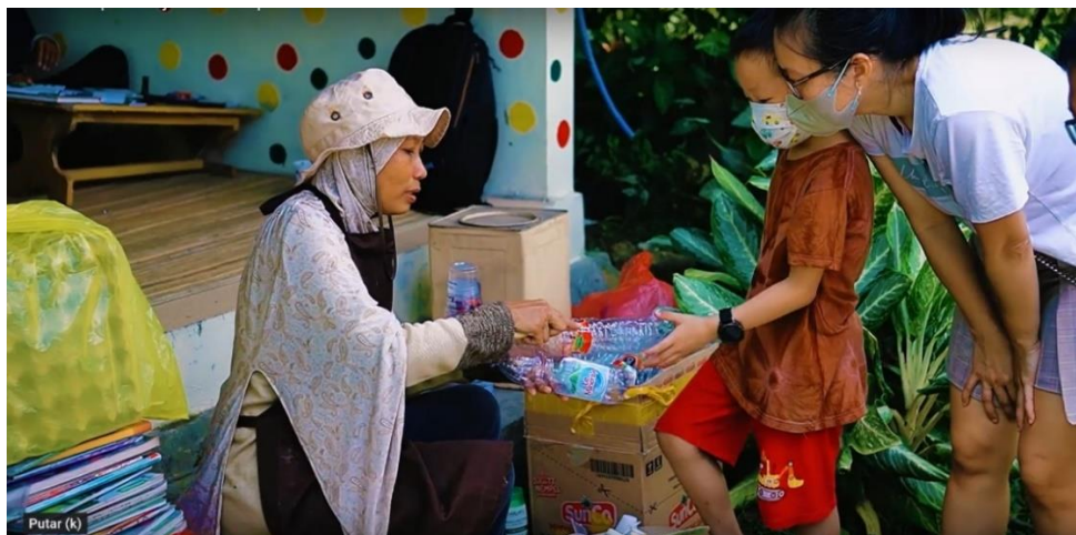
Gambar 5. Kegiatan Menabung di Bank Sampah Ramli Graha Indah

Didalam video profil juga memuat kegiatan yang dilakukan oleh Bank Sampah Ramli Graha Indah setiap minggunya. Kegiatan tersebut adalah proses menabung sampah yang dilakukan oleh nasabah seperti terlihat pada Gambar 5.