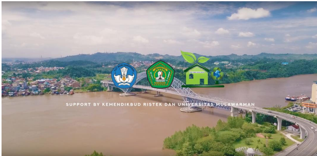
Gambar 4. Opening Video Profil

Pada Gambar 4. Menampilkan opening dari video profil Bank Sampah Ramli Graha Indah yang memiliki 3 logo Lembaga sebagai bagian dari video profil ini. Video ini dibuat menggunakan kamera drone dengan tujuan untuk menginformasikan bahwa video profil ini merupakan kegiatan pengabdian yang berada di Kota Samarinda.