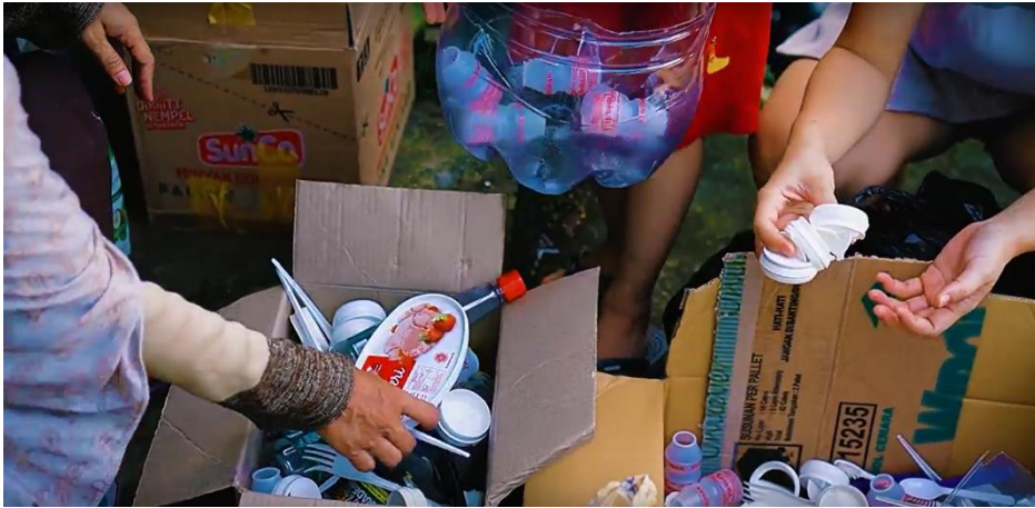
Gambar 6. Proses Pemilahan Sampah

Gambar 6. menampilkan kegiatan pemilahan sampah yang dilakukan oleh Bank Sampah Ramli Graha Indah sebagai bentuk edukasi bagi masyarakat. Pemilahan sampah terdiri dari beberapa kategori yaitu sampah plastik biasa, botol plastik berwarna biru dan bening, kertas, dll.