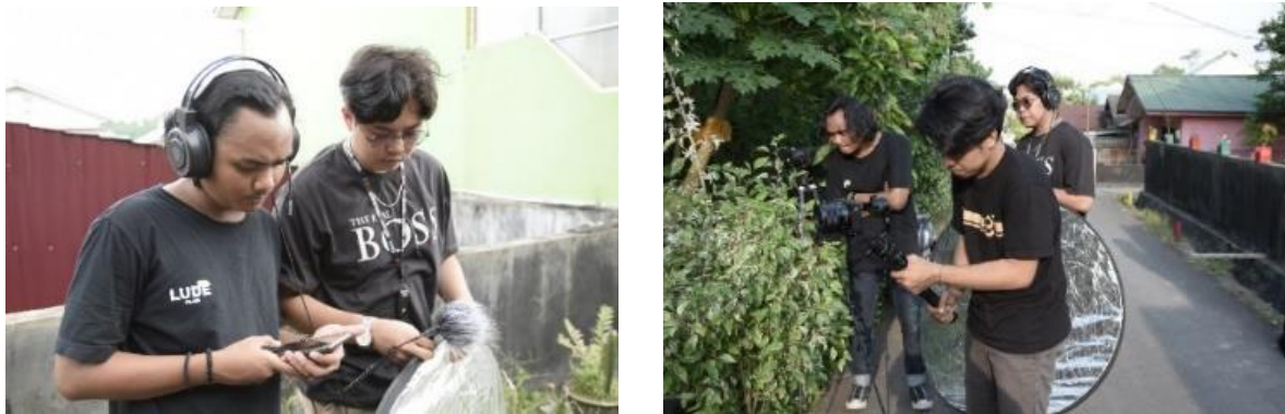
Gambar 3. Proses Pengambilan Video

Selanjutnya properti lain yang menjadi alat pendukung dalam proses produksi video profil adalah headphone, laptop, dan gimbal kamera. Gambar 3. merupakan proses pembuatan video profil menggunakan alat-alat pendukung.