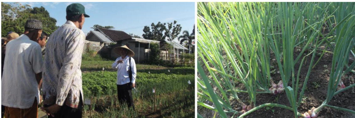
Gambar 1. Petani sedang mengikuti penjelasan tentang proses penanaman dan pertumbuhan varietas unggul dan benih bermutu bawang merah

Kegiatan pengabdian masyarakat ini telah dilakukan untuk meningkatkan pengetahuan dan ketrampilan petani mitra “Sumber Hidup” desa Sigerongan untuk memanfaatkan lahan sempit dengan menanam bawang merah melalui pemanfaatan varietas unggul dan benih unggul. Pada kegiatan ini, teknik komunikasi yang dilakukan oleh tim penyuluh adalah penyuluhan secara langsung yaitu tatap muka ( face to face communication ) antara penyuluh dengan petani. Metode secara langsung digunakan agar para petani mendengar dan memberikan respon langsung dan cepat pada materi penyuluhan yang disampaikan. Tim penyuluh menyampaikan materi penyuluhan di lahan demplot percobaan. Menurut Martanegara (1993) bahwa metode langsung dianggap lebih efektif untuk meyakinkan dan mengakrabkan hubungan antara penyuluh dan petani serta cepatnya respon atau umpan balik dari sasaran. Gambar 1 menjelaskan tentang kegiatan ceramah tatap muka antara penyuluh dengan anggota kelompok “Sumber Hidup”.